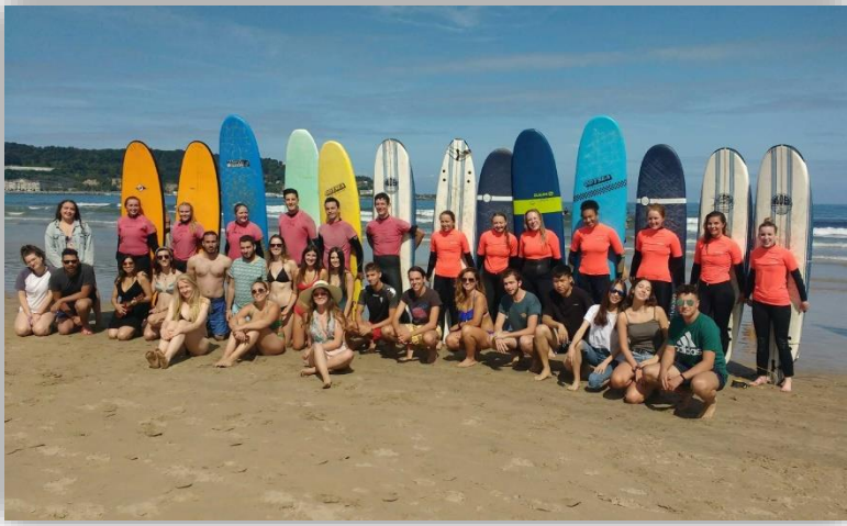
International student orientation programme - 2019