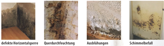
defekte Horizontalsperre Querdurchfeuchtung Ausblühungen Schimmelbefall

SIE SIND EIGENTÜMER UND HABEN PROBLEME MIT FEUCHTIGKEIT ODER SCHIMMEL IM KELLER ODER WOHNBEREICH?