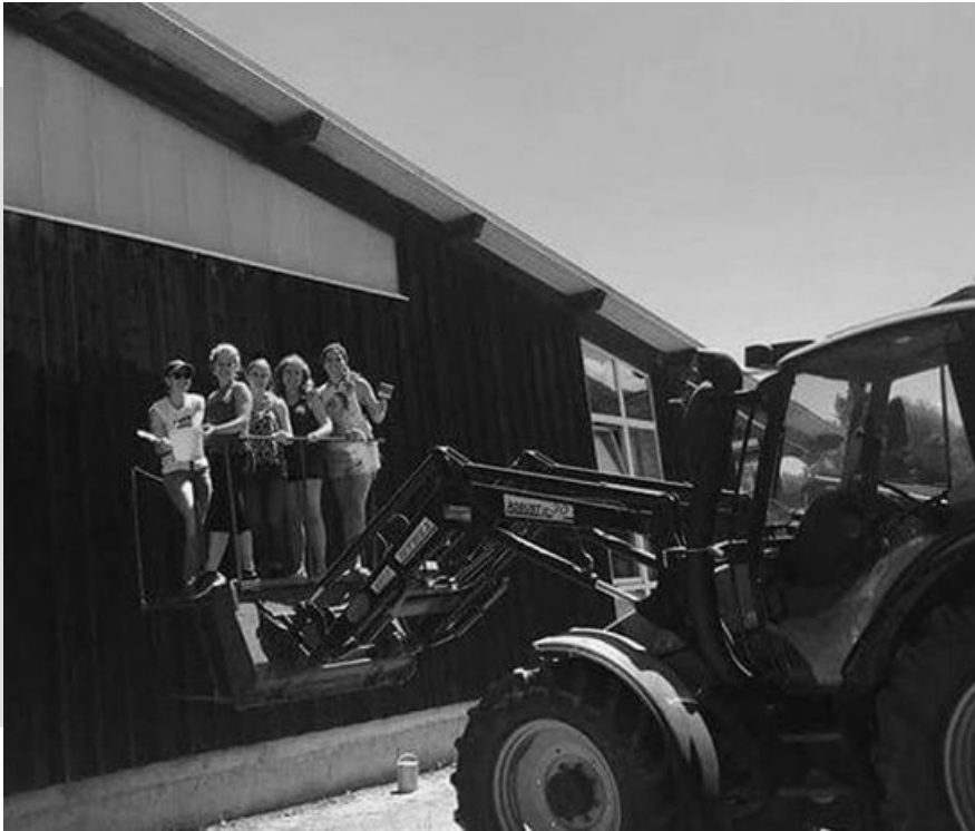
„Unser Stall soll schöner werden“ Malereinsatz beim Reit-Club Konstanz