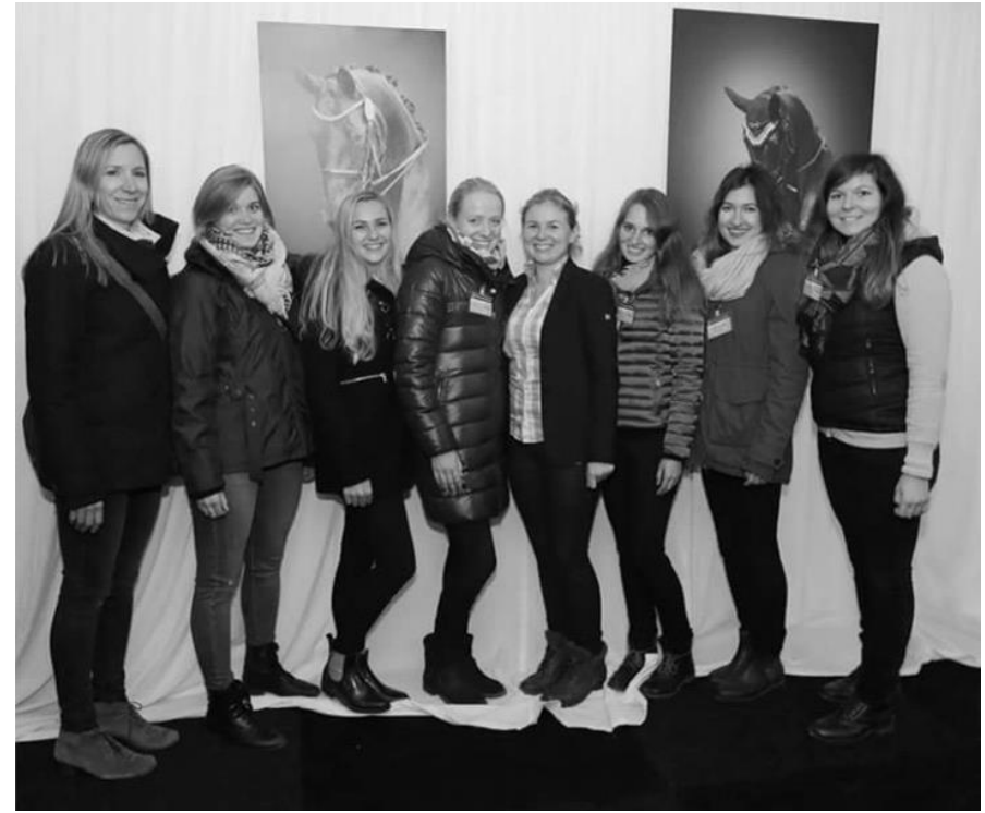
CHI Donaueschingen 2017 Unsere fleißigen Helferinnen im VIP-Zelt