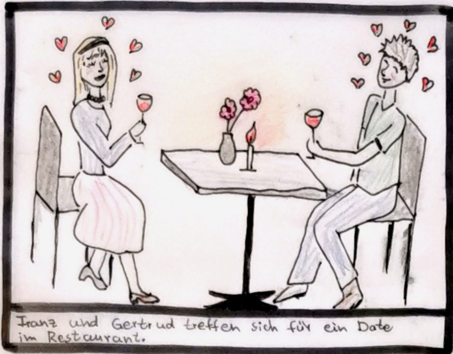
Franz und Gertrud treffen sich für ein Date im Restaurant.