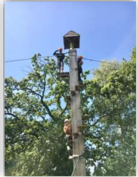
International student orientation programme - 2019