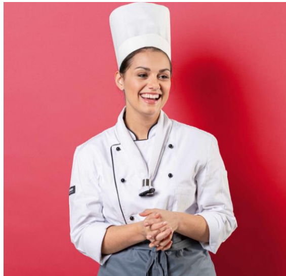
Gastronomie & Hotel