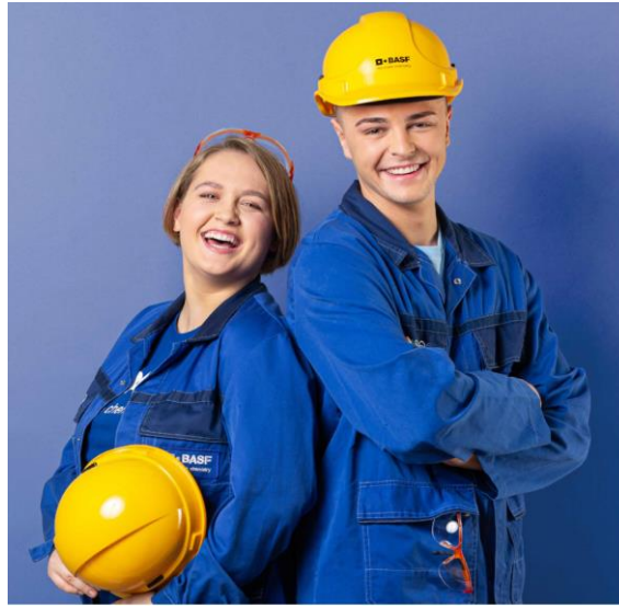
Elektro- und Metalltechnik