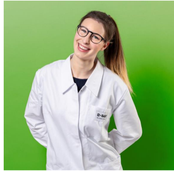
Naturwissenschaft- liche Ausbildung