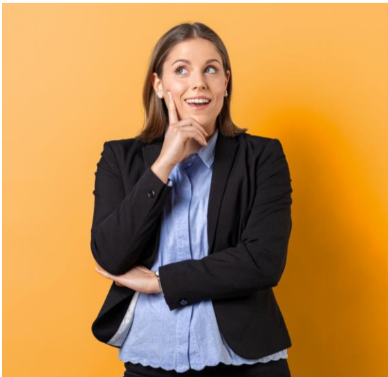
Kaufmännisch & IT